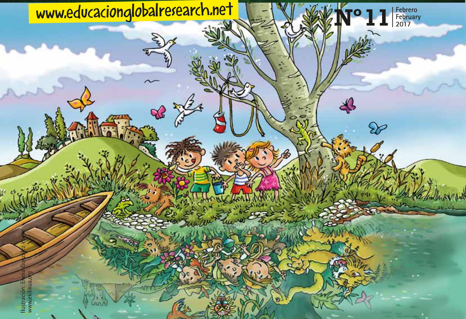
Ilustración: Eneko González Xarabe www.eklikua.org